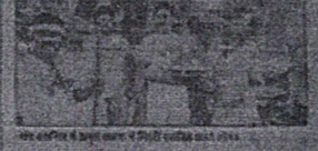
मौसम विभाग के अनुसार, देश में औसत तापमान 35.5 डिग्री सेल्सियस रहने का अनुमान है।