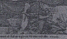
मौसम विभाग के अनुसार, देश में औसत तापमान 35.5 डिग्री सेल्सियस रहने का अनुमान है।

मौसम विभाग के अनुसार, देश में औसत तापमान 35.5 डिग्री सेल्सियस रहने का अनुमान है। पिछले आठ साल में सबसे गर्म मंगलवार रहा। मौसम विभाग के अनुसार, देश में औसत तापमान 35.5 डिग्री सेल्सियस रहने का अनुमान है।