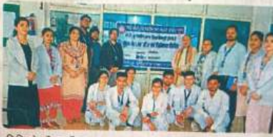
-शिविर के दौरान मौजूद स्टाफ।

शिवपुरी, जिले के दिनारा में थनरा शिव पीके यूनिवर्सिटी में संचालित महावीर प्रसाद मेमोरियल अस्पताल में बुधवार को दो दिवसीय निःशुल्क स्वास्थ्य शिविर का समापन हुआ। शिविर में 120 मरीजों ने जांच कराई। यह शिविर फैकल्टी ऑफ मेडिकल साइंस के तत्वाधान में हुआ।