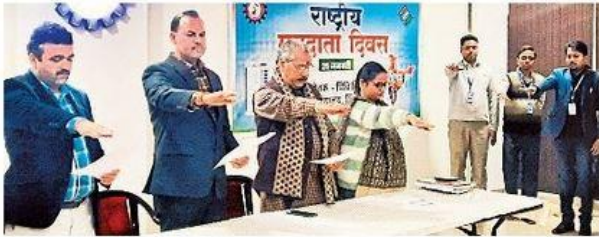
मतदाता दिवस पर शपथ लेते शिक्षक और कर्मचारी।