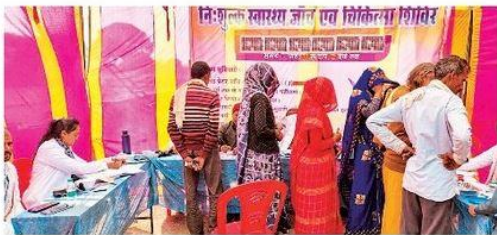
शिविर में दवाइयों का वितरण करते डॉक्टर।

शिवपुरी. पीके विश्वविद्यालय परिसर में संचालित पंडित महावीर प्रसाद मेमोरियल अस्पताल के तत्वावधान में ग्राम पंचायत कूंड में शनिवार को एक दिवसीय निःशुल्क चिकित्सा परामर्श शिविर लगाया गया। शिविर का उद्देश्य गरीब और जरूरतमंद लोगों को मुफ्त स्वास्थ्य सुविधा प्रदान करना था। निःशुल्क चिकित्सा परामर्श शिविर में 200 से अधिक मरीजों की जांच कर उन्हें उचित चिकित्सकीय परामर्श के साथ-साथ वर्तमान समय में बढ़ती बीमारियों से बचाव के उपाय भी बताए। साथ ही उन्हें निःशुल्क दवाइयों का वितरण एवं उचित दरों पर पैथोलॉजी जांच की सुविधा उपलब्ध कराई।