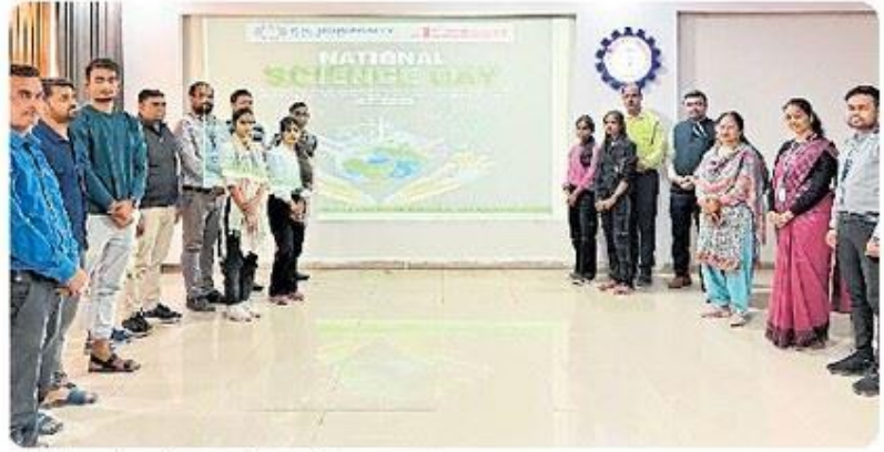
कार्यक्रम के दौरान मौजूद शिक्षक एवं छात्र।