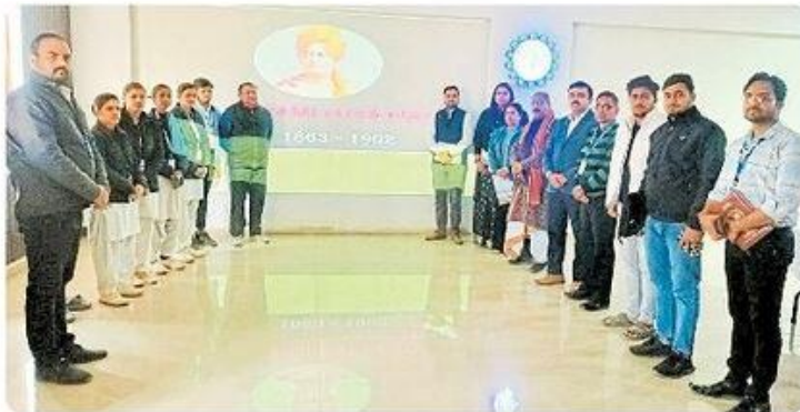
शिविर में मौजूद विश्वविद्यालय का स्टाफ।