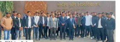
विद्यार्थियों ने बंजर भूमि को उपजाऊ बनाने के लक्ष्य पर

पीके यूनिवर्सिटी के कृषि संकाय के विद्यार्थियों ने बंजर भूमि को उपजाऊ बनाने के लक्ष्य पर