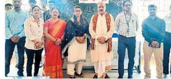
कार्यक्रम के दौरान छात्र छात्राओं को जागरूक करने पहुंचे प्रोफेसर।

शिवपुरी. पीके यूनिवर्सिटी द्वारा एंटी-रैगिंग जागरूकता सप्ताह का आयोजन किया गया। इस पहल का उद्देश्य उच्च शिक्षण संस्थानों में रैगिंग की बुराई को रोकना और छात्रों, शिक्षकों और कर्मचारियों के बीच जागरूकता बढ़ाना है। जागरूकता सप्ताह का समापन समारोह विश्वविद्यालय परिसर के विश्वेश्वरय्या ऑडिटोरियम में हुआ। इस दौरान विभिन्न गतिविधियों का आयोजन किया गया। इनमें नुकसैन नाटक, पोस्टर मेकिंग, स्लोगन प्रतियोगिता और क्रिज प्रतियोगिताएं शामिल थीं। प्रतियोगिताओं का उद्देश्य प्रतिभागियों को एंटी रैगिंग उपायों को बढ़ावा देने के लिए प्रोत्साहित करना है। इसके अतिरिक्त, छात्रों और शिक्षकों के लिए एंटी-रैगिंग जागरूकता मूवी की स्क्रीनिंग भी की गई, जिसके के पाठ्यक्रम से संदेश दिया गया कि रैगिंग जैसी क्रूर प्रथाएं न केवल शैक्षणिक भावों को नष्ट करती हैं, बल्कि विद्यार्थियों के मानसिक और सामाजिक विकास में भी गंभीर बाधा