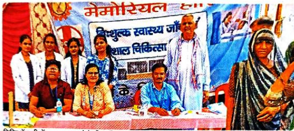
शिविर में ग्रामीणों का इलाज करने के लिए मौजूद डॉक्टर।