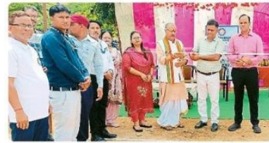
प्रतियोगिता के दौरान मौजूद विश्वविद्यालय के कुलमुरु एवं प्रोफेसर।